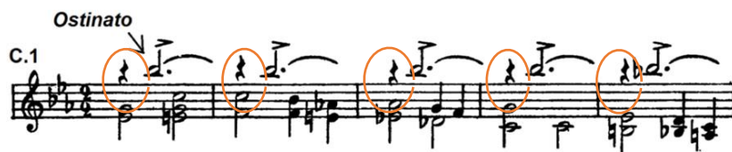
Figura 5 – Coral Canto do Sertão . Seção A. Ostinato (nota Si bemol) (FELICE, 2016)

Nos compassos iniciais da peça (figura 5), nota-se a repetição de uma nota mais aguda em ostinato , sendo esta, provavelmente, sua característica mais marcante: o Canto da Araponga. “O canto triste e monótono da Araponga” (TARASTI, 1995, p. 203), com a escrita da nota Si bemol na voz superior das frases, caracteriza-se pela articulação em martello de uma nota curta e aguda em ostinato . Essa é uma referência ao canto desse pássaro que migra para o Sertão em tempos mais chuvosos, o que se atribui a essa nota um caráter de tópica nordestina (TARASTI, 1995), a qual sugere o título Canto do Sertão .