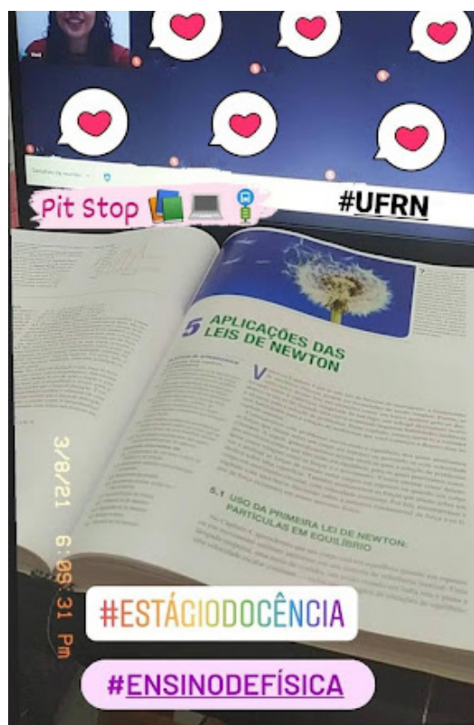
Imagem: Registro do Pit Stop.

A contribuição da atividade pode ser verificada no desempenho dos alunos nos simulados e nas avaliações. Dados obtidos a partir do questionário de avaliação aplicado com a turma no final do semestre, mostram que 85,7% dos alunos afirmam que quanto à aquisição de novas informações, esclarecimento de dúvidas e preparação para as atividades avaliativas da disciplina, os Pit Stops contribuíram significativamente. A principal dificuldade na execução da atividade foi encontrar um horário que ficasse mais confortável para a turma, diante da demanda de atividades do semestre.