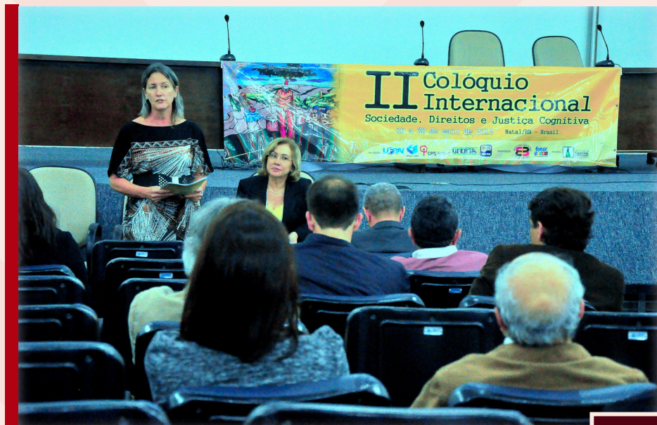
Fig. 10 - Abertura do Colóquio. Platéia no Auditório da Reitoria da Universidade Federal do Rio Grande do Norte.