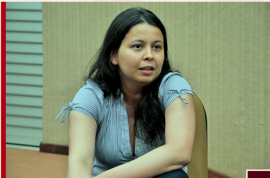
Fig. 6 - Reunião Acadêmica - Troca de Experiências. Auditório do NEPSA (Núcleo de Pesquisa em Ciências Sociais Aplicadas - UFRN). Pesquisadora do CES - Centro de Estudos Sociais da Universidade de Coimbra.