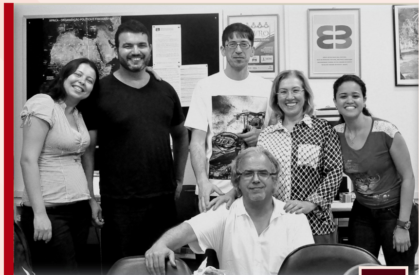
Fig. 24 - Momento de Convivência entre Organização do Colóquio e Professores do CES - Centro de Estudos Sociais da Universidade de Coimbra.