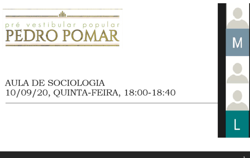
Figura 2: Projecção de imagem na plataforma Zoom . À direita, avatares representam parte dos estudantes presentes na “sala de aula virtual”.

Durante o período remoto a plataforma adquiriu ainda uma outra funcionalidade: a de canal de convocatória para as aulas. Por meio do grupo, os professores enviavam aos estudantes os endereços e senhas de acesso às salas virtuais do software Zoom (Figura 1). Em ambiente “online” as aulas tiveram o início antecipado para às 18:00 horas e foram encurtadas em 10 minutos, de modo que o fim de um dia letivo ocorria uma hora antes (às 21:00 horas) quando comparado ao período presencial. Essa medida foi adotada para evitar desgastes com o novo formato de aulas, que se mostraram mais cansativas para todos, além da dificuldade maior por parte dos estudantes em não terem a atenção dispersa.