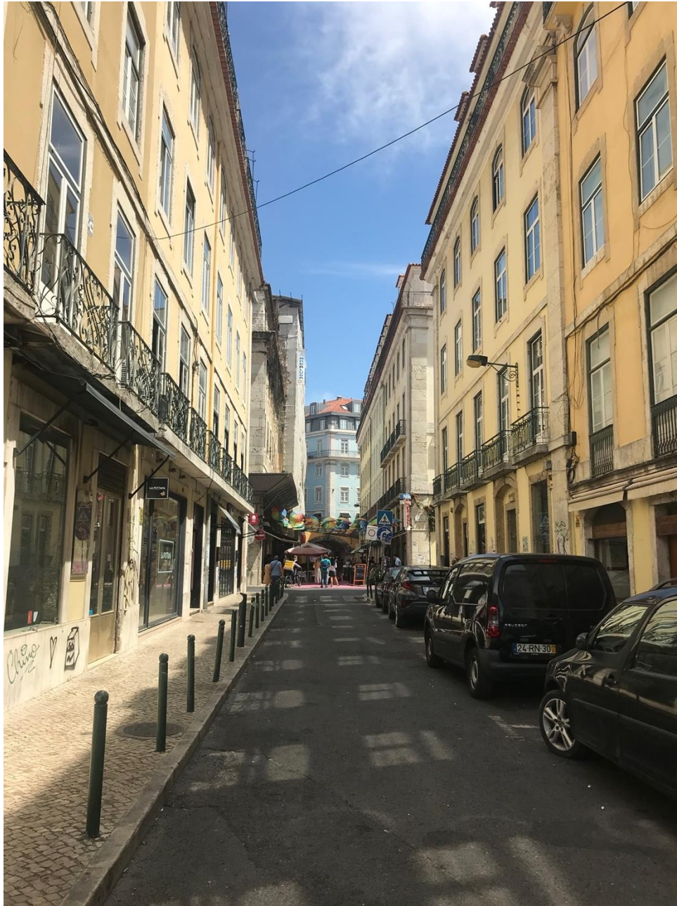
2. Sol (ver. Dia); Sun (Day ver.); Sol (ver. Día); Início do dia na Rua Nova de Carvalho (antes de chegar à Pink Street). (07/2022).