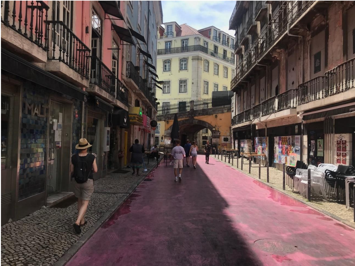
6. Apenas de viagem (ver. Dia); Travel only (Day ver.); Solo viajar (ver. Día) Durante o dia os bares e discotecas permanecem fechados. Foto: Autores (07/2022).