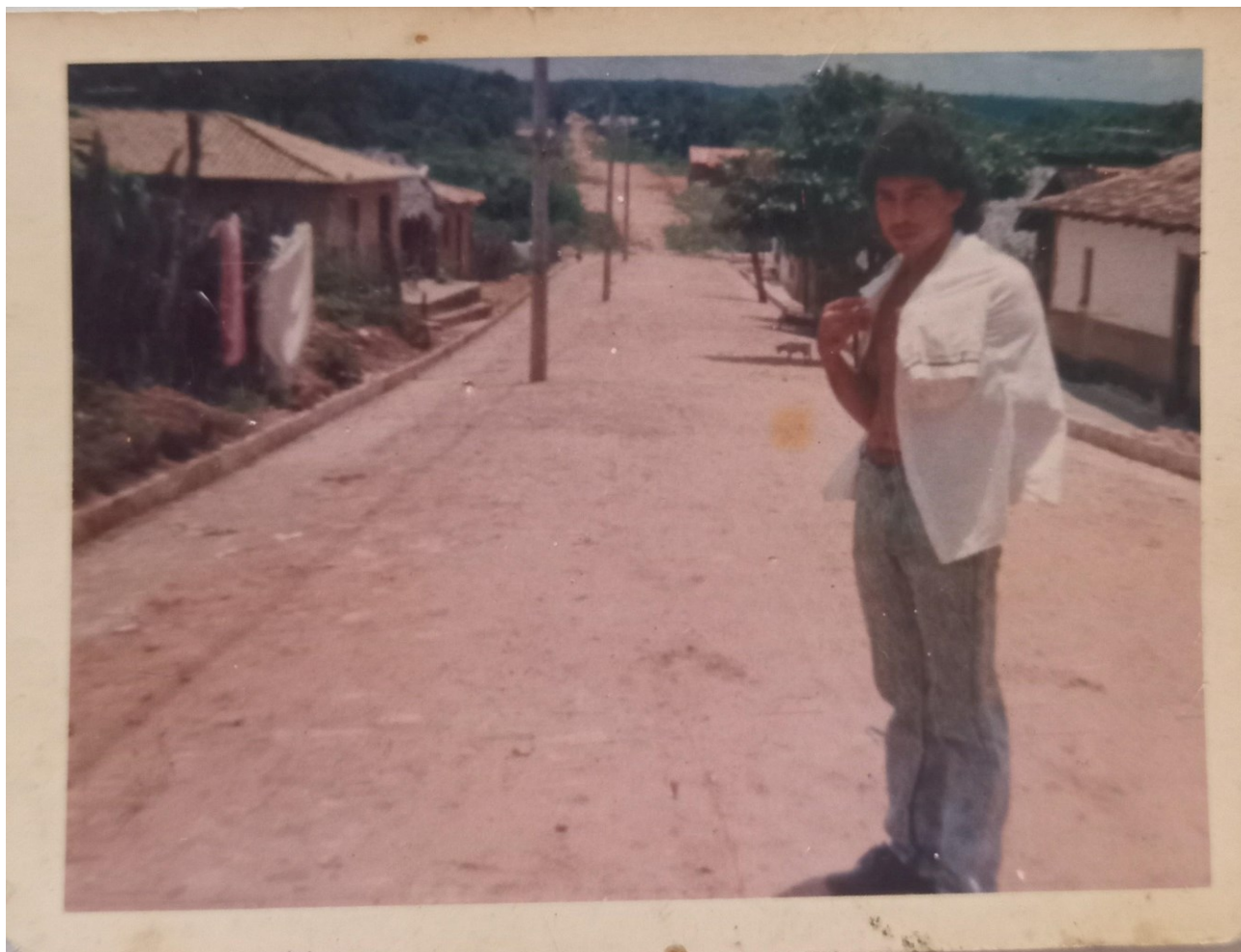
9. Canto do Buriti (PI).

Acervo pessoal de Analice. Foto: Ana Clara Damásio (03/2025).