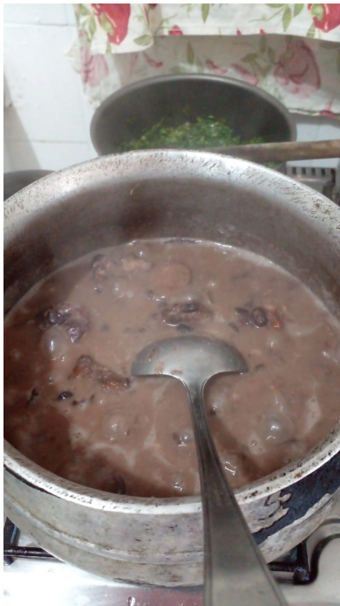
5. Do fogareiro ao fogão: a “panela” de mugunzá (onde se faz feijoada) Acervo pessoal de Itamar. Foto: Ana Clara Damásio (05/2019).