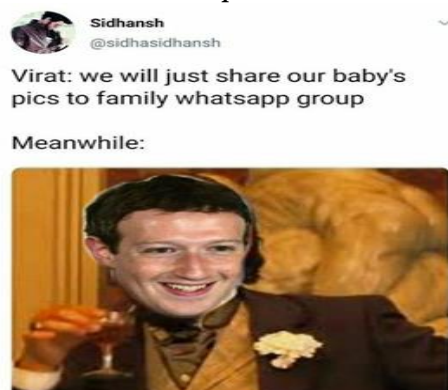
Imagem 4 – Meme sobre a privacidade nas redes sociais

Fonte: Página All India Memes no Instagram 5