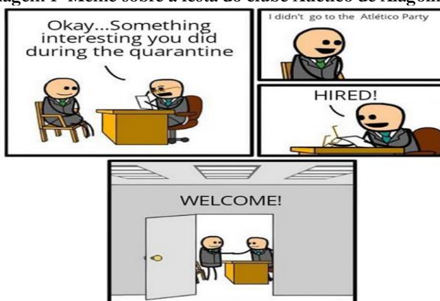
Imagem 1- Meme sobre a festa do clube Atlético de Alagoinhas.

Por meio de atividades voltadas para a leitura e produção do gênero meme e da subsequente discussão dos sentidos interculturais identificados, pudemos perceber que alguns elementos se apresentaram de forma mais enfática e os dividimos nas seguintes categorias: 1- meme e criticidade, 2- meme e expressão identitária, 3- meme e multimodalidade intertextual. A respeito da primeira categoria, o aspecto crítico dos memes foi percebido como um fator significativo para refletir sobre os diversos elementos (inter)culturais existentes no mundo globalizado e como estes se correlacionam com nossas vivências sociais e particulares: