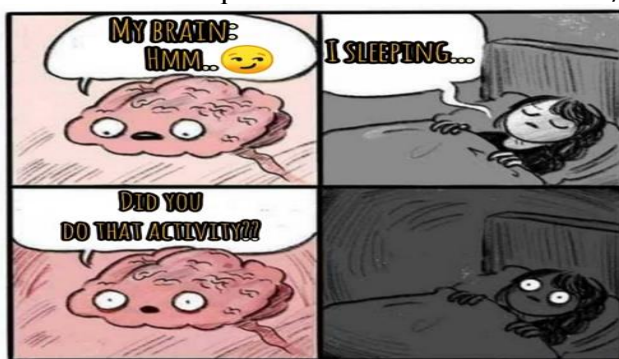
Imagem 3 – Meme sobre o esquecimento de atividades escolares/acadêmicas

A impressão desse contato entre línguas também ocorreu na produção dos colaboradores. Como falantes não nativos da língua inglesa, os colaboradores utilizaram a estratégia de aproximação da língua alvo com a língua materna, a fim de se comunicarem de forma mais fluida no inglês. Neste sentido, pudemos observar que isso, por vezes, os levava a provocar erros na comunicação, imprimindo sentidos diferentes dos tencionados – a exemplo do emprego do estrangeirismo “ notebook ”, que em português é utilizado pra designar um tipo de aparelho tecnológico, mas em inglês significa “caderno” – bem como semelhantes, com erros gramaticais não intencionais que, típicos do gênero em questão, somente adicionaram mais sentidos de riso: