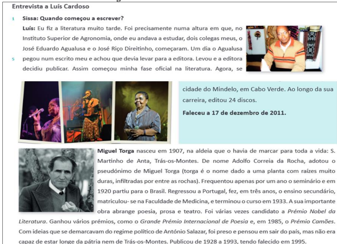
Figura 4 - Recortes extraídos do livro didático