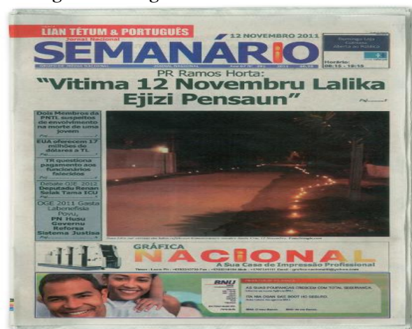
Figura 3 - Imagem extraída do livro didático

Ademais, enfocamos, a seguir (Figura 3), excertos do referido manual a fim de exemplificar como as referências timorenses e portuguesas ou europeias disputam o espaço do livro didático e, conseqüentemente, a formação dos alunos, os sentidos de harmonia na história colonial, os modelos de sociedade e o valor que deseja empregar a elas.