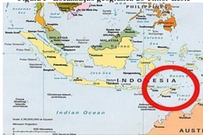
Figura 1 - Localização geográfica do Timor-Leste