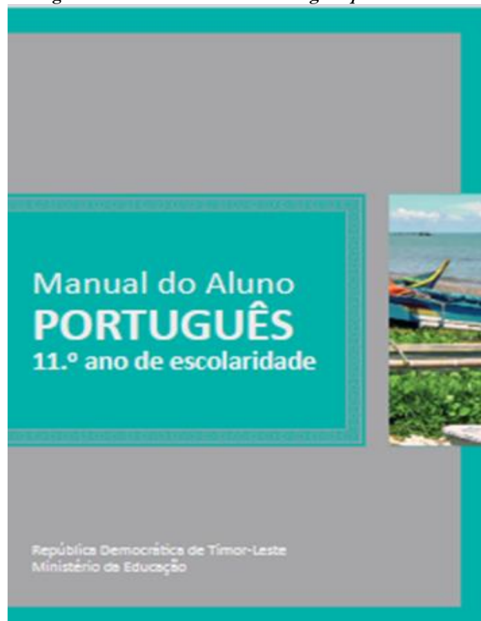
Figura 2 - Manual do Aluno - Português para o 11º Ano

O manual considerado no enfoque das reflexões aqui delimitadas, trata-se do “Manual do Aluno - Português” para o 11º Ano em Timor Leste. Ele é uma produção em cooperação entre o Ministério da Educação de Timor-Leste, o Instituto Português de Apoio ao Desenvolvimento, a Fundação Calouste Gulbenkian e a Universidade de Aveiro Financiamento do Fundo da Língua Portuguesa.