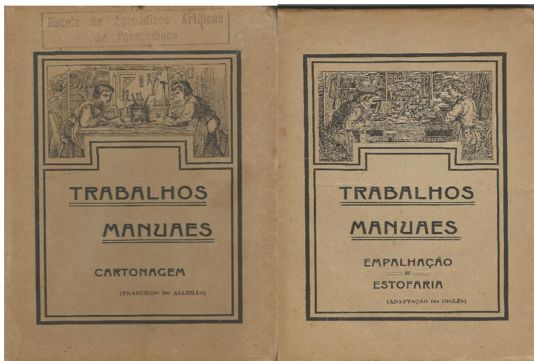
Imagem 01: Capas dos livros de trabalhos manuais de cartonagem e empalhação e estofaria