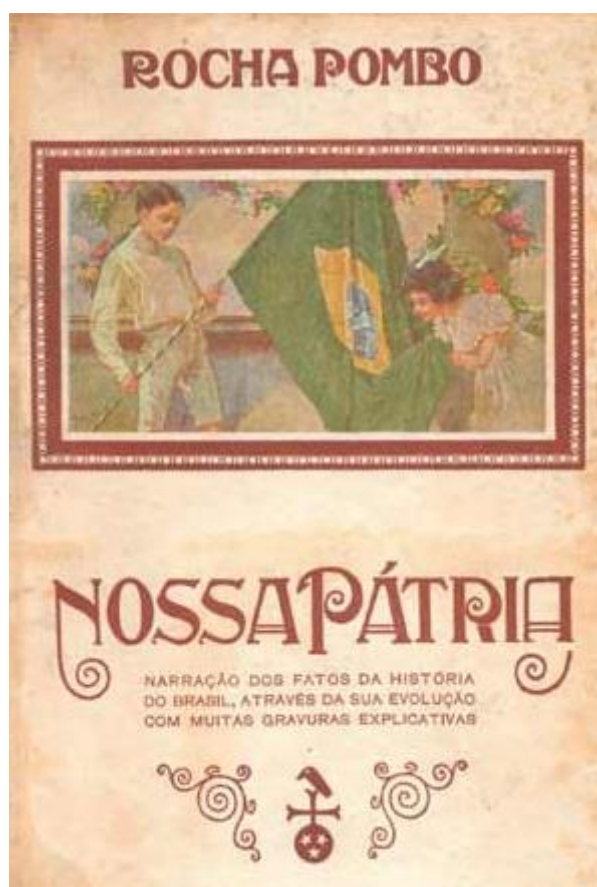
Imagem 03: Capa do manual Nossa Pátria , de Rocha Pombo (1ª edição: 1917).