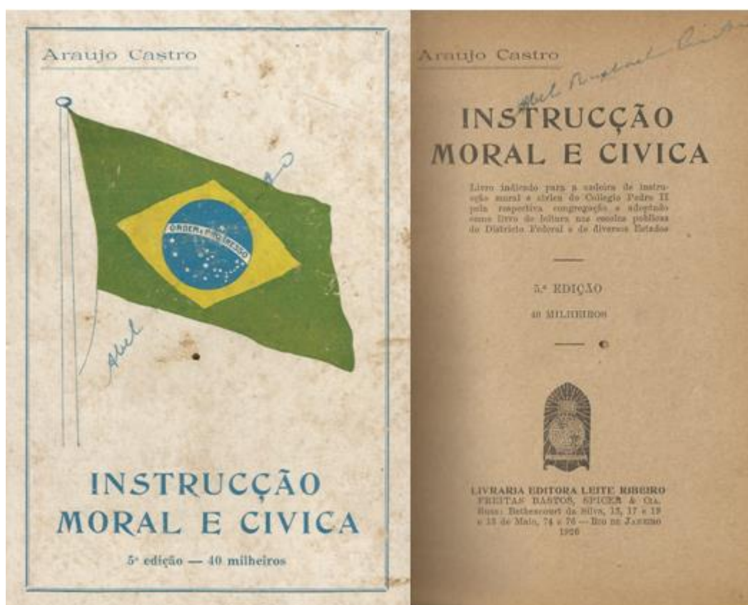
Imagem 02: 1ª e 2ª capas da obra Instrução Moral e Cívica (5ª edição: 1926), de Araújo Castro.

No que diz respeito à organização das obras, elas também se parecem. O Manual e a Instrução têm lições curtas e ao final de cada uma delas há um questionário. Relativamente à Instrução , essas questões são também curtas, de redação simples e muito objetivas. Diferentemente do que propõe o método das Lições de coisas , as questões postas por Castro exigiam do aluno muito mais a memorização de elementos apresentados pelo autor, do que o senso crítico. Nem por isso, deixava de haver na obra o incentivo à prática, posto que em diferentes momentos Castro ressaltava que os exemplos de pais e professores, tomados como guardiães da moral e dos bons costumes, eram muito mais valiosos aos pequenos do que quaisquer lições de livros.