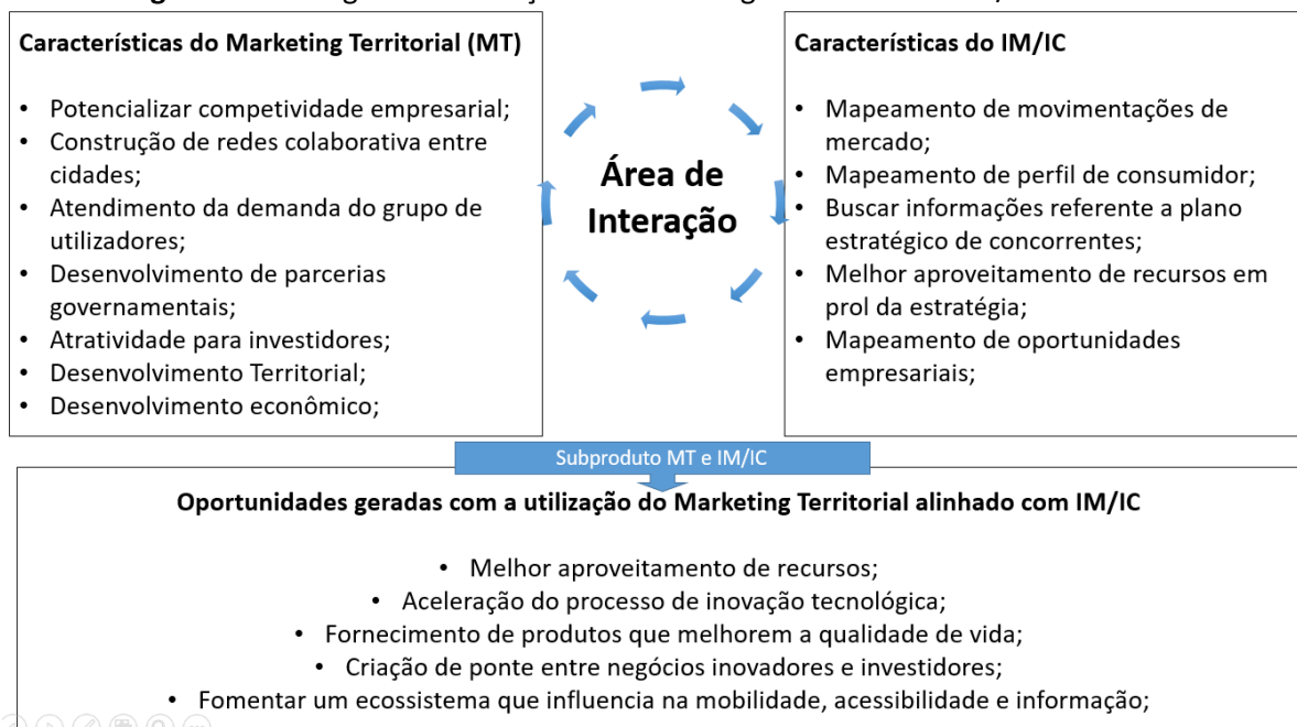
Figura 1 – Vantagem da utilização do Marketing territorial com IM/IC