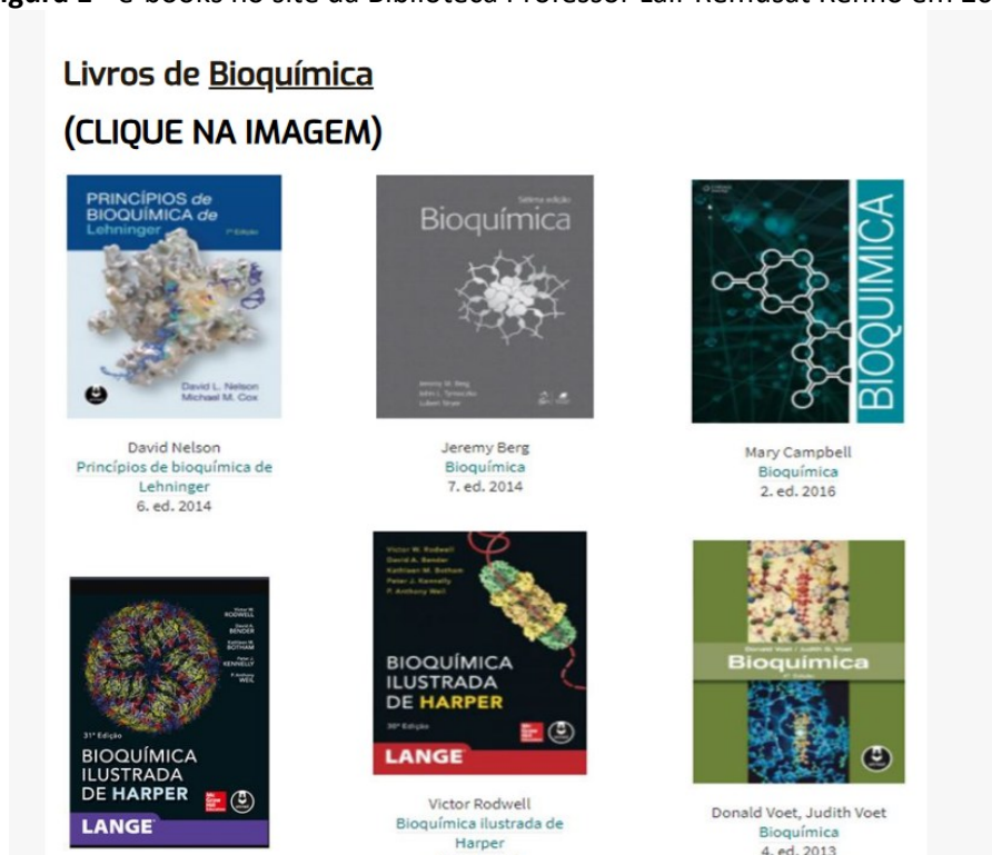
Figura 1 - e-books no site da Biblioteca Professor Lair Remusat Rennó em 2020

O levantamento final resultou em um total de 264 títulos, dos quais 13 apresentavam duplicidade, por estarem contemplados em mais de uma área do conhecimento. Em seguida, a planilha foi encaminhada ao Setor de Tecnologia da unidade, que desenvolveu uma aba específica no site da Biblioteca 5 para a disponibilização dos e-books, conforme indicado na Figura 1.