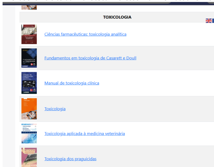
Figura 2 - e-books no site da Biblioteca Professor Lair Remusat Rennó em 2025