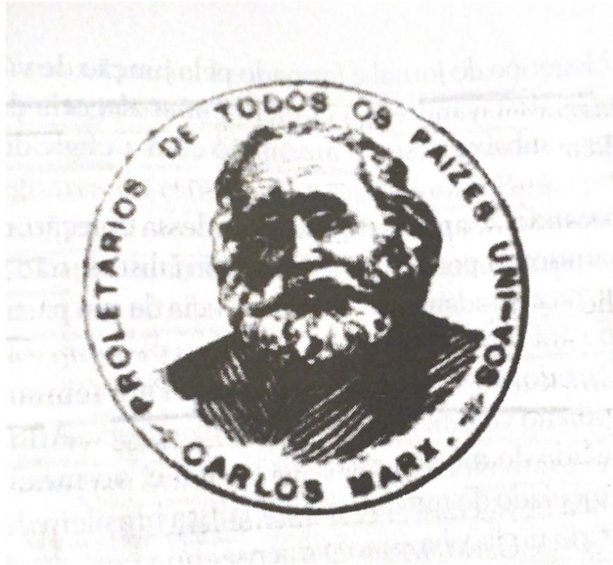
Foto 3 - Carlos Marx desenhado e litografado por Carlos Wiegandt. Medalhão (ampliado) estampado junto ao logotipo de O trabalho , Belém, a partir do 1º número. Col. Da Biblioteca Artur Viana, CENTUR, Belém do Pará

Fonte: Vicente Salles (2001, p. 79). Adaptado pelo autor.