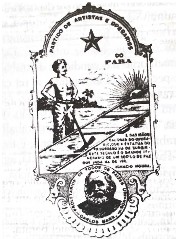
Foto 2 - Carlos Marx desenhado e litografado por Carlos Wiegandt. Medalhão estampado junto ao logotipo de O trabalho , Belém, a partir do 1º número. Col. Da Biblioteca Artur Viana, CENTUR, Belém do Pará

Fonte: Vicente Salles (2001, p. 78). Adaptado pelo autor.