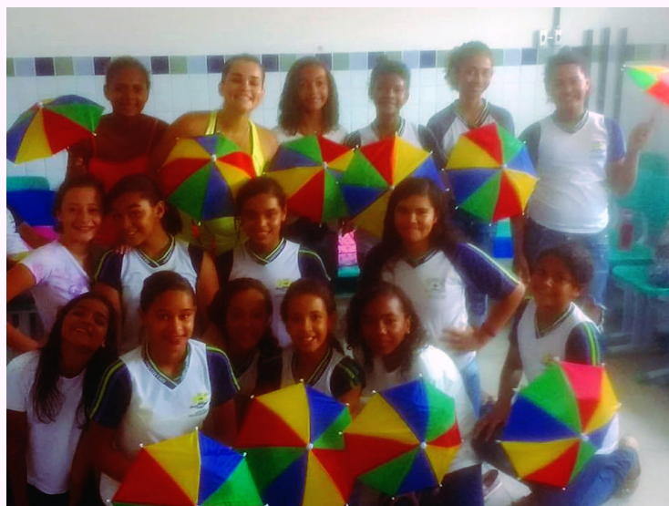
(Alunas da Oficina de Frevo na Escola Luiz Lua Gonzaga - Jaboatão dos Guararapes – PE)