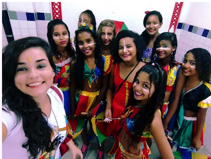
Alunas da Escola Luiz Lua Gonzaga - Jaboatão dos Guararapes - Apresentação na Festa da Pitomba 2017 – Frevo