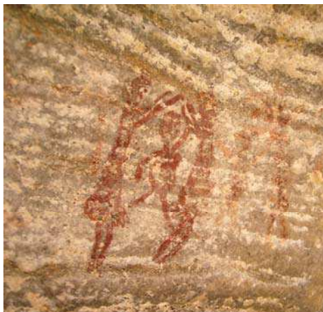
Estilo Carnaúba, detalhe do Sítio Arqueológico Xique-xique II, em Carnaúba dos Dantas/RN, evidenciando grafismo emblemático

Partiu-se do argumento citado anteriormente - que as pinturas rupestres constituem um sistema comunicativo -, para encaminhar a pesquisa numa direção que nos levou à percepção de que a partir da leitura das imagens encontradas nos sítios