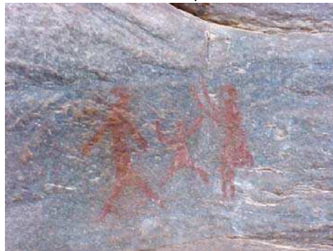
Estilo Carnaúba, detalhe do Sítio Arqueológico Xique-xique I, em Carnaúba dos Dantas/RN, com grafismo emblemático