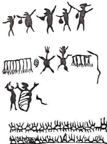
Imagens do Sítio Arqueológico Xique-xique I, em Carnaúba dos Dantas/RN, feitas por José de Azevedo Dantas, em 1924