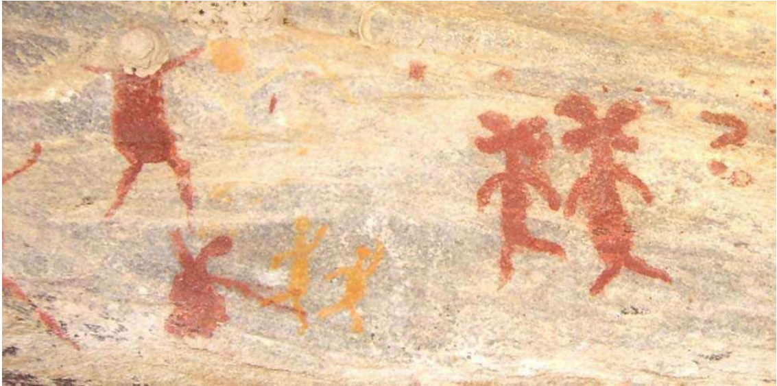
Detalhe do Sítio Arqueológico Abrigo do Morcego, em Carnaúba dos Dantas/RN, evidenciando sobreposição de imagens

É levantada assim a hipótese de um deslocamento migratório, quando percebemos, em muitos abrigos inseridos na Sub-tradição Seridó, pinturas que apresentam características bastante semelhantes ao estilo Serra da Capivara do Parque Nacional, no Piauí. Um exemplo dessas características são os antropomorfos com a “cabeça de caju”, presentes em boa parte da Região (Fotos 05 e 06).