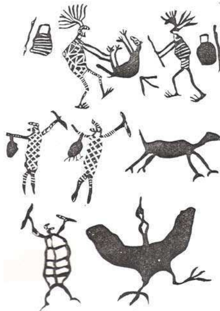
Imagens do Sítio Arqueológico Xique-xique I, em Carnaúba dos Dantas/RN, feitas por José de Azevedo Dantas, em 1924