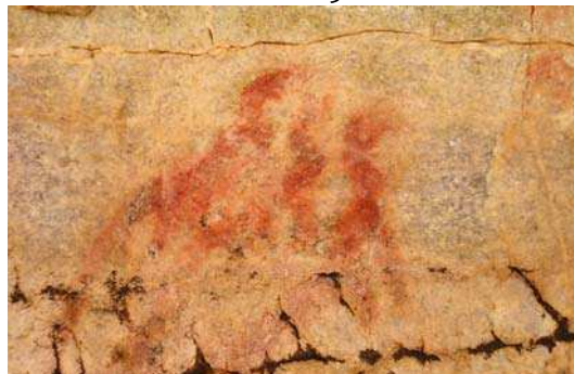
Detalhe do Sítio da Mão Redonda, em Carnaúba dos Dantas/RN, evidenciando “cabeça de caju”