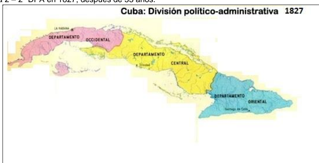
Figura 2 – 2ª DPA en 1827, después de 53 años.