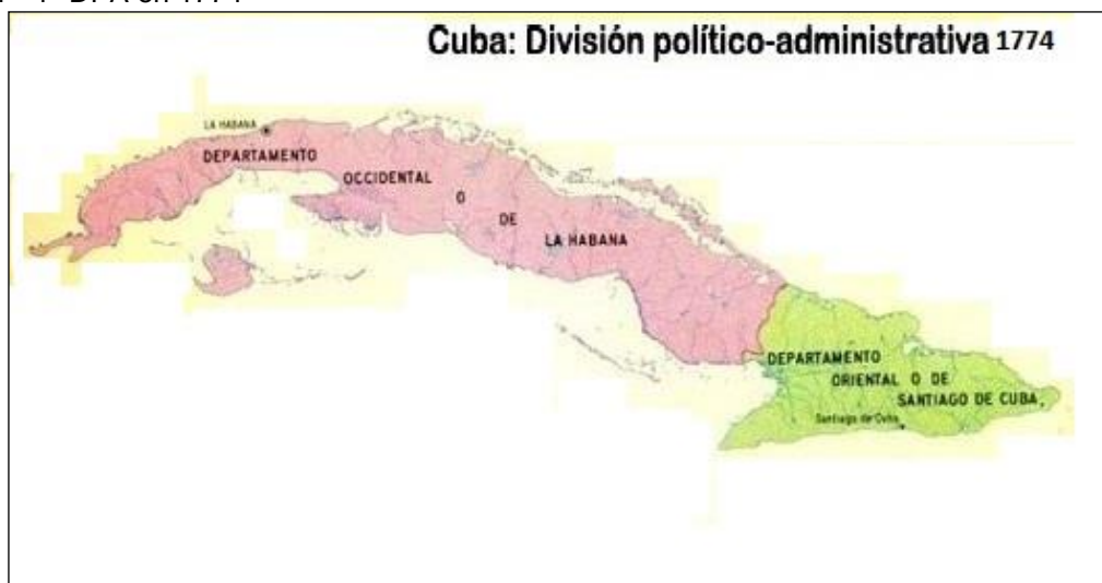
Figura 1 - 1ª DPA en 1774