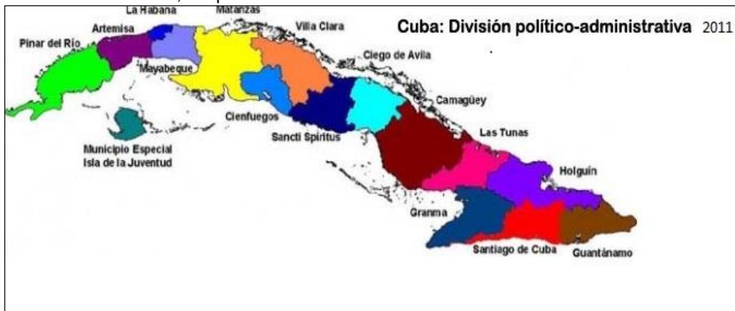
Figura 8 – 7ª DPA en 2011, después de 35 años