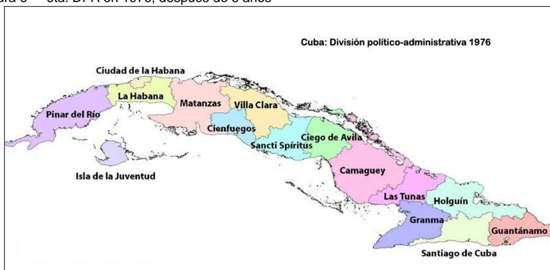
Figura 6 - 6ta. DPA en 1976, después de 6 años