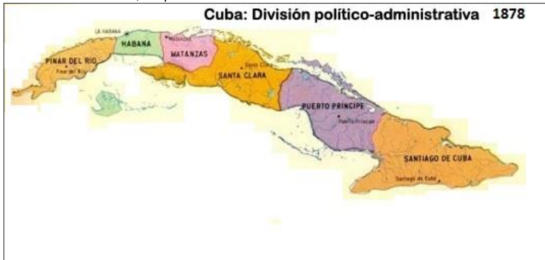
Figura 3 – 3ª DPA en 1878, después de 51 años