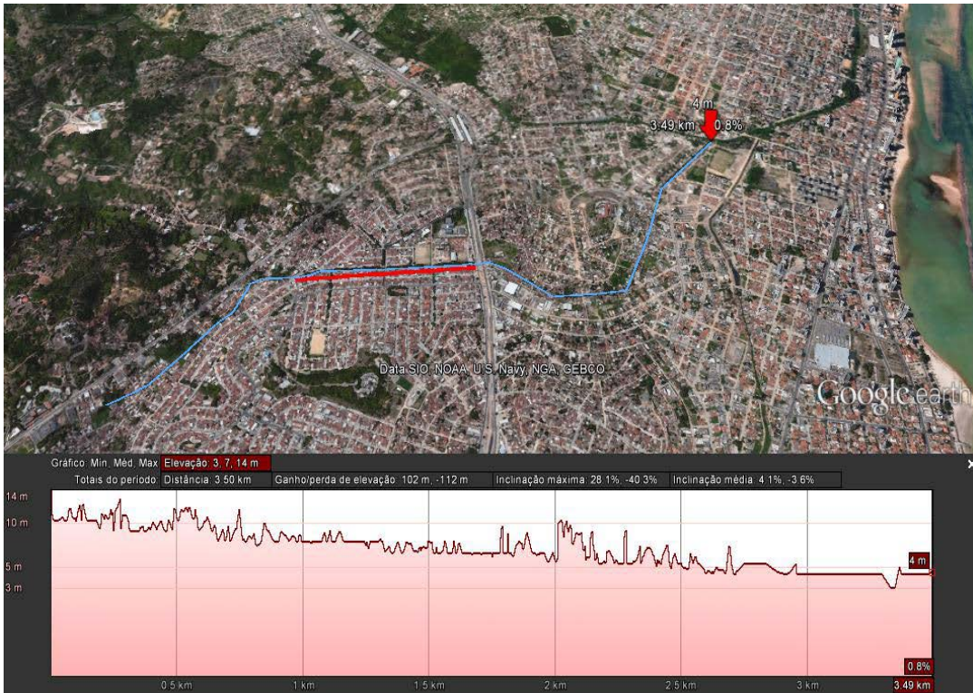
Figura 5: Perfil longitudinal do riacho Ouro Preto apresentando baixo gradiente (12 a 4 metros em 3,5 quilômetros) com pico altimétricos em pontos de estruturas antropogênicas.