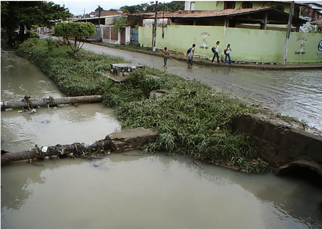
Figura 3: Trecho do canal retificado com estruturas de canalização de água e de despejo de águas servidas.

quantidade de resíduos sólidos no interior do canal ou em suas margens, além do lançamento de águas servidas provenientes de áreas residenciais, o que aumento o potencial de extravasamento das águas fluviais.