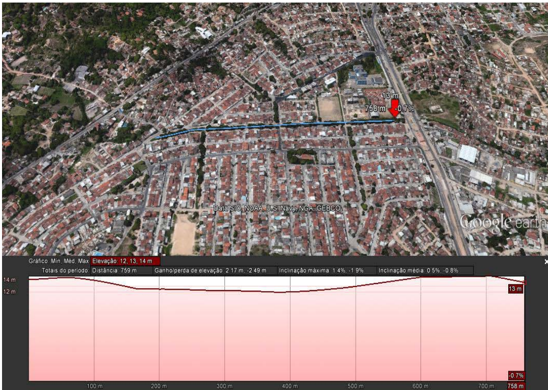
Figura 6: Perfil longitudinal do trecho analisado, apresentando sobressaltos no início e final do trecho em decorrência de estruturas antropogênicas que comprometem a fluidez do canal.