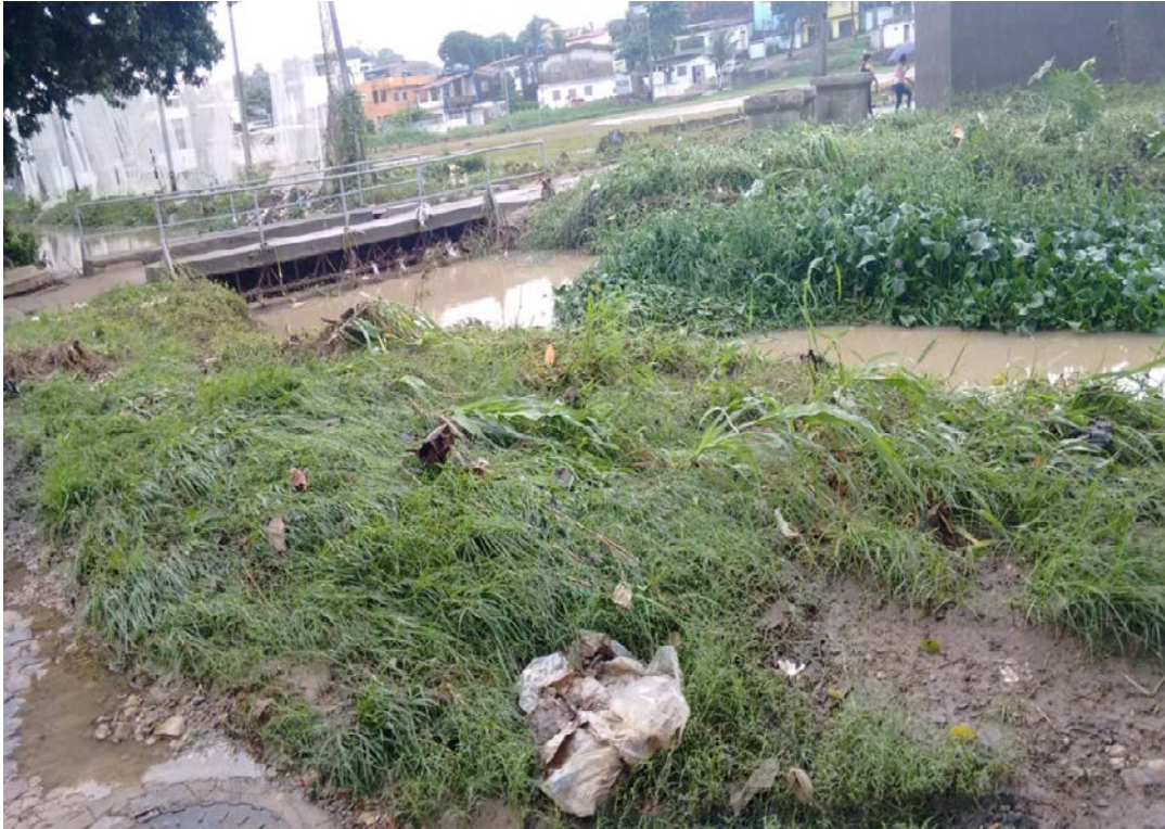
Figura 4: Vegetação ripária densa avançando sobre o canal. Na figura a vegetação encontra-se “abatida” pelo fluxo da corrente relacionada ao aumento do nível das águas quando de um evento pluvial extremo ocorrido em 31/05/2016.