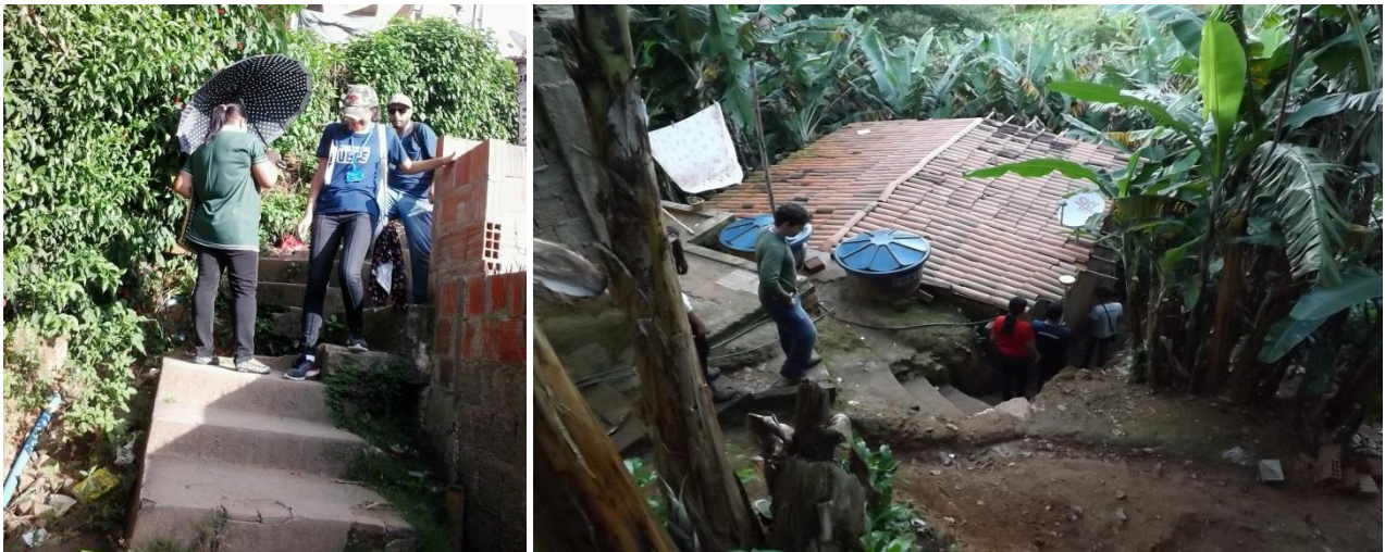
Figuras 3 e 4– Escadaria de acesso oficial (administrado pela prefeitura) à comunidade Alto Bela Vista e escada improvisada pelos moradores para acesso a residências.

Outro fator que torna a promoção da acessibilidade na Comunidade Alto Bela Vista uma atividade complexa são as escadarias existentes no segundo acesso oficial na comunidade, permitindo apenas a circulação de pedestres. As escadarias não seguem um padrão, além de não apresentarem corrimões ou rampas para a locomoção de pessoas com limitações de locomoção (Vide figura 3 e 4).