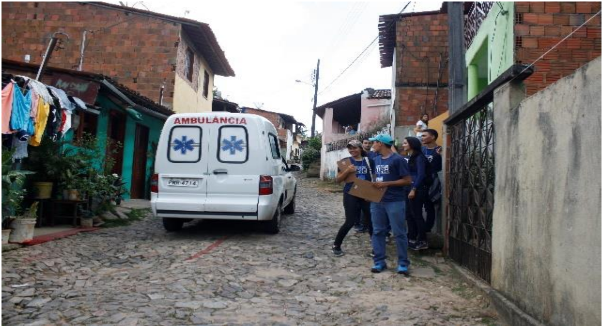
Figura 2: Ambulância no acesso oficial que permite o tráfego de veículos na comunidade Alto Bela Vista.