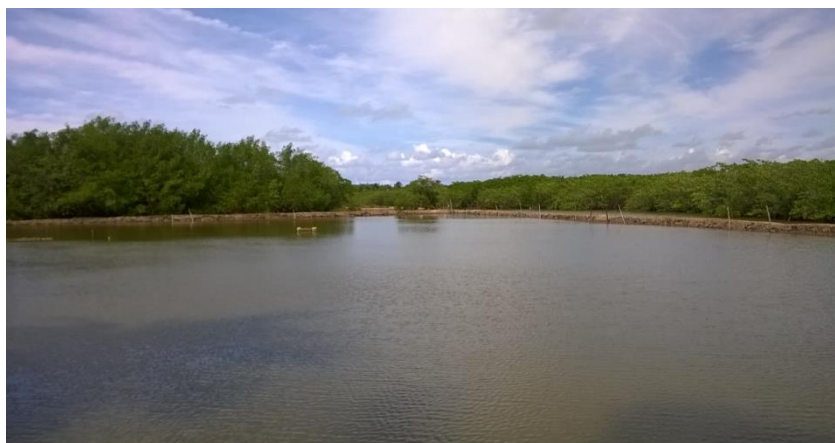
Figura 03. Viveiro de camarão instalado em mangue – Povoado Carapitanga Brejo Grande/SE.

O declínio da rizicultura e a expansão da carcinicultura imprimem na paisagem novos processos de produção do espaço. Dentre estes, ressaltam-se mudanças na utilização das técnicas de manejo, o surgimento de possíveis problemas ambientais com a introdução de espécie exótica no ecossistema aquático e o impacto sobre a condição de renda das famílias inseridas na cadeia produtiva, seja ela negativa ou positiva. Segundo o relato de carcinicultores, a atividade possibilita obter maior lucro em relação à pesca artesanal e à cata de mariscos. Entretanto, menos mão-de-obra é necessária para a atividade, reduzindo os postos para o trabalhador rural.