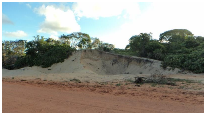
Figura 04. Duna costeira inativa com evidência de extração mineral nas proximidades do povoado Carapitanga/SE.

Além das transformações na paisagem provocadas pelo desenvolvimento das atividades produtivas abordadas, há a extração mineral realizada nas dunas costeiras inativas. A retirada dos sedimentos arenosos nessas feições propicia a reativação de processos eólicos, em função supressão da vegetação nativa e com isso amplia-se a descaracterização paisagística na área (Figura 04).