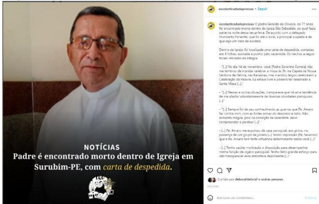
Imagem 1 – “Padre é encontrado morto dentro de Igreja em Surubim – PE, com carta de despedida”