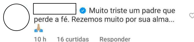
Imagem 2 – Comentario hecho en la publicación de @escolasticadepressao

En solo dos días, la publicación generó un total de 600 comentarios que reflejaban una amplia diversidad de reflexiones. Entre todas estas respuestas, hubo un enunciado concreto que capturó nuestra atención: “Muito triste um padre que perde a fé” (Es muy triste ver a un sacerdote perder la fe).