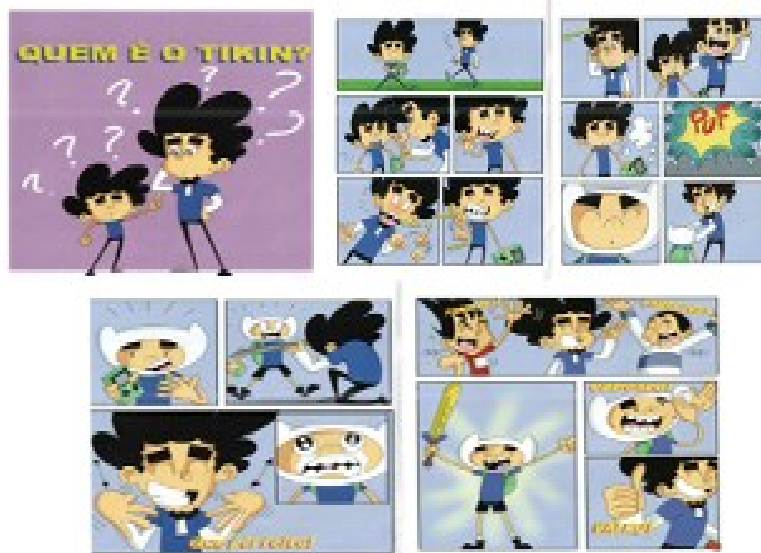
Figura 2: Trechos da obra com marcas de heteroglossia

A busca por essa diferenciação pode ser interpretada como o fazer com que esse sujeito passe a usar uma outra língua, ou seja, deixe de ser um sujeito sinalizante ou que simplesmente minimize as semelhanças físicas entre eles. Nesse cenário, as vozes do surdo e do ouvinte se colocam em relação de contraponto: a voz do surdo emerge tensionando a voz do ouvinte, cuja base discursiva está ancorada em processos de normalização do sujeito surdo. Trata-se, portanto, de uma esfera discursiva marcada pela coexistência e pelo confronto entre esses dois discursos, dinâmica que se mantém, como se observa na figura 2.