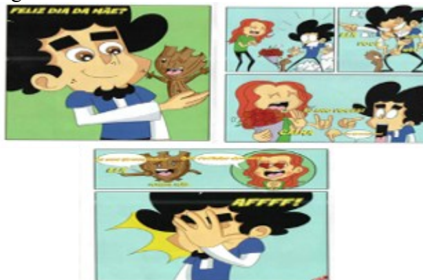
Figura 3: Trechos da obra com verbo-visualidade

A narrativa também apresenta um intenso diálogo entre diferentes sistemas semióticos (Língua Portuguesa, Libras e elementos imagéticos) que contribuem para a construção da heteroglossia no discurso, conforme a figura 3.