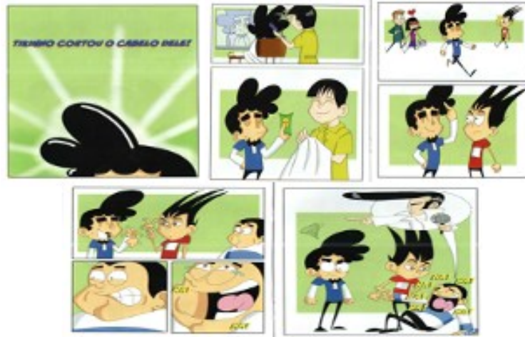
Figura 4: Recorte da narrativa 3- “Tikinho cortou o cabelo dele!”

Na narrativa 3, que retrata a ida de Tikinho ao barbeiro, a Libras não é mobilizada, aparece , conforme exposto na figura 4.