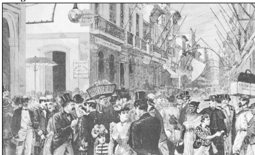
Figura 2 – Cotidiano da Rua do Ouvidor no século XIX.