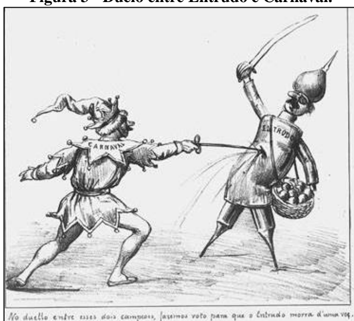
Figura 3 - Duelo entre Entrudo e Carnaval.