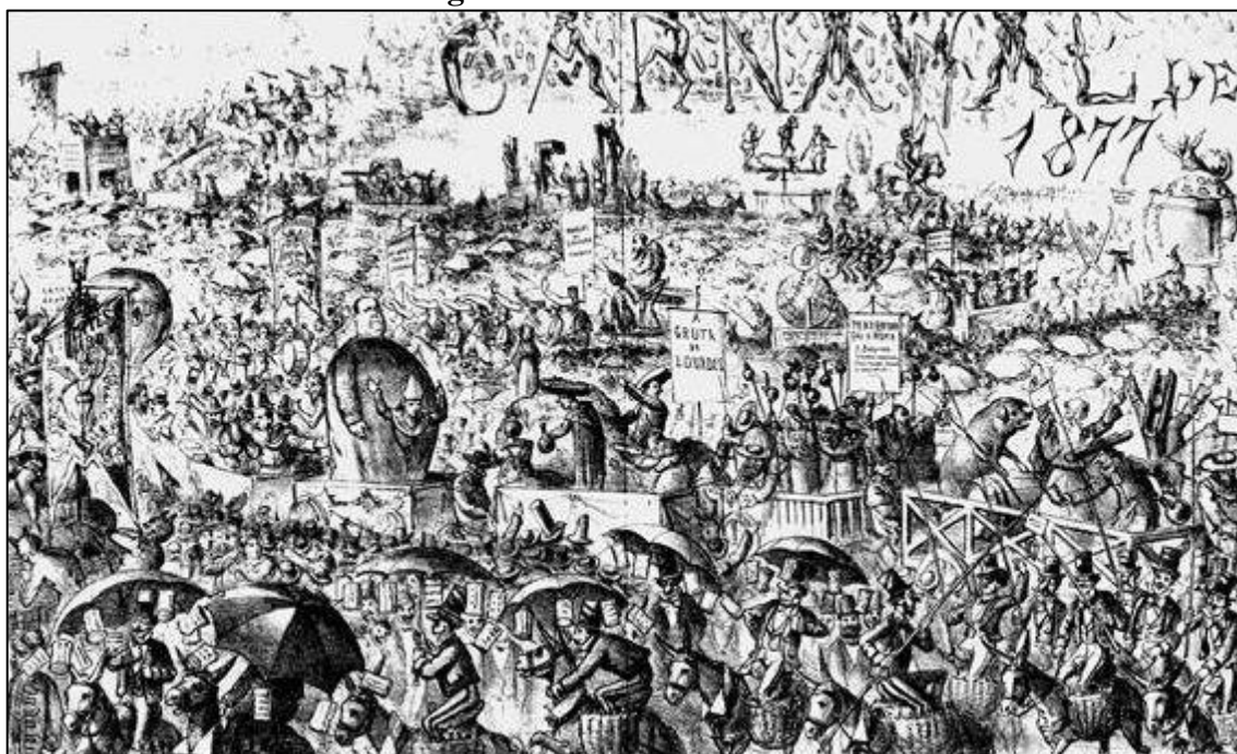
Figura 5: Carnaval de 1877.

Fonte: Revista Illustrada, Ano 2, n. 55, 1877 7 .