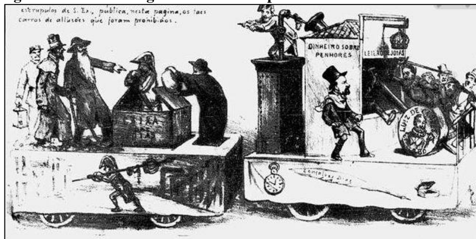
Figura 4 – Carros Alegóricos utilizados pelas Sociedades no ano de 1883.