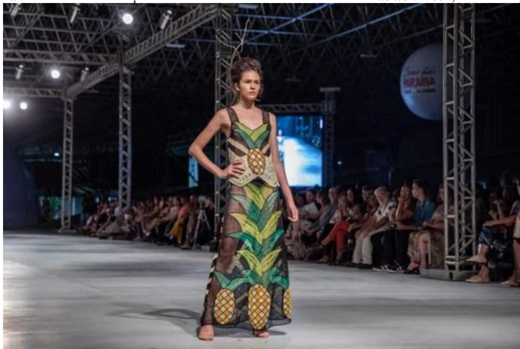
Figura 2 – Desfile da coleção Somos Todos Paraíba no São Paulo Fashion Week , São Paulo, 2020

Ainda, quando esses processos são excluídos da equação, o valor da mercadoria é determinado pelo trabalho abstrato, como enfatiza Rubin (1980). A aproximação entre sujeito e consumidor se dá por meio da invisibilidade do trabalho e do social. Esse processo oculta as relações sociais, enquanto um trabalho humano, e as condições de trabalho que os originaram, provocando o fetichismo da mercadoria. Um exemplo é a renda renascença, como destaque no São Paulo Fashion Week (SPFW) da coleção “Somos Todos Paraíba” (Figura 2).