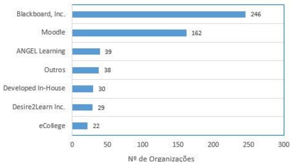
Figura 2 – Quota de Mercado dos LMS nas Organizações de Ensino

Fonte: Adaptado de Wexler, Grey, Miller, Nguyen e Barneveld (2008, p.31).