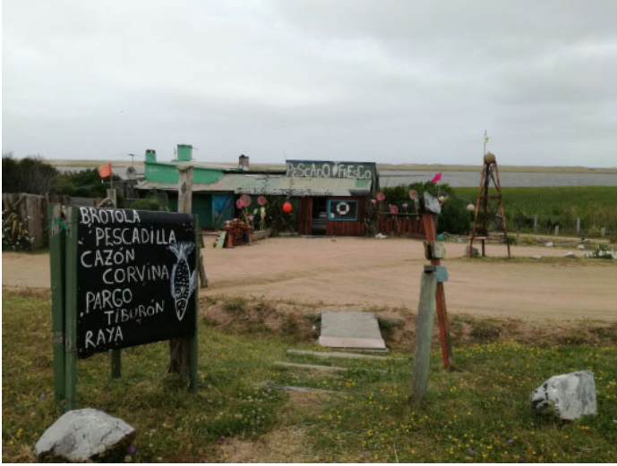
Figura 7 – Puesto de venta de familia pescadora con Barra Arenosa de Playa en el fondo (2017)