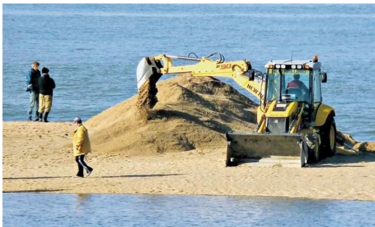
Figura 8 – Apertura de la barra con retroexcavadora (2011)