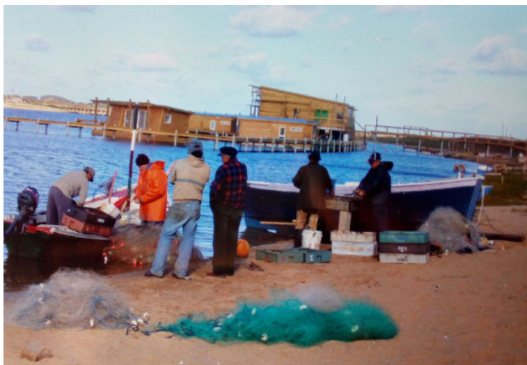
Figura 5 – Pescadores desenmallando en Laguna Garzón (2014)

En este mismo sentido, es difícil ocultar en la laguna los lugares de pesca, ya que, como veremos a continuación los materiales suelen permanecer muchas horas en el agua. Asimismo, el uso de boyas con banderines de tela y colores identificatorios, hace que unos y otros puedan saber a quién pertenecen los materiales de pesca que se encuentran colocados al salir a la laguna. Dado que son pocos los pescadores que están de forma permanente, es sencillo reconocer a quién pertenecen los materiales.