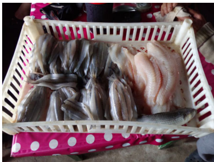
Figura 6 – Pescado fileteado: Pejerrey a la palomita a la izquierda, Lenguado a la derecha

Como vemos, en algunos casos, la estacionalidad puede no ser tan determinante, allí la disponibilidad de la especie se ve sujeta a otras variables naturales y socio-ambientales del entorno de la laguna, de acuerdo a las observaciones realizadas por los interlocutores.