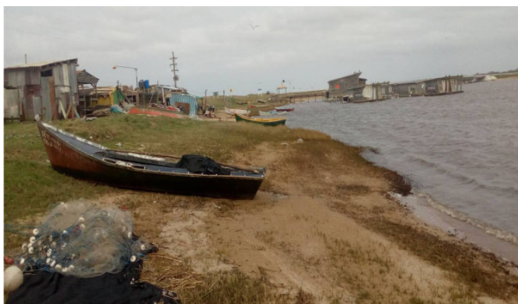
Figura 1 – Vista de la costa de la laguna a las casas de los pescadores

En el estudio que presentamos aquí, los pescadores artesanales se han dedicado a la práctica de la pesca en la laguna con las características que veremos a continuación.