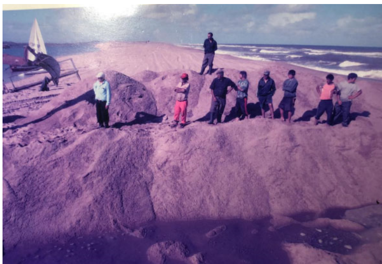
Figura 9 – Apertura de la barra de Laguna Garzón (2007)