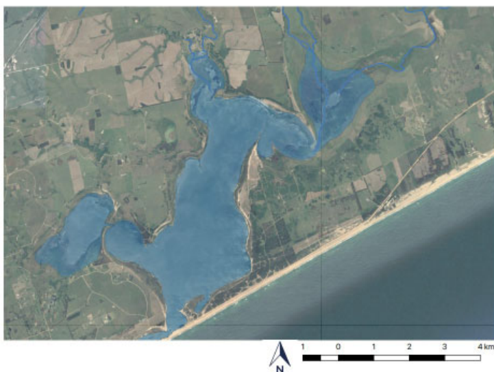
Figura 3 – Foto satelital de Laguna Garzón (2018)