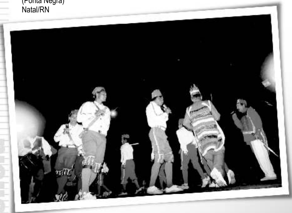
Congos de Calçola (Ponta Negra) Natal/RN