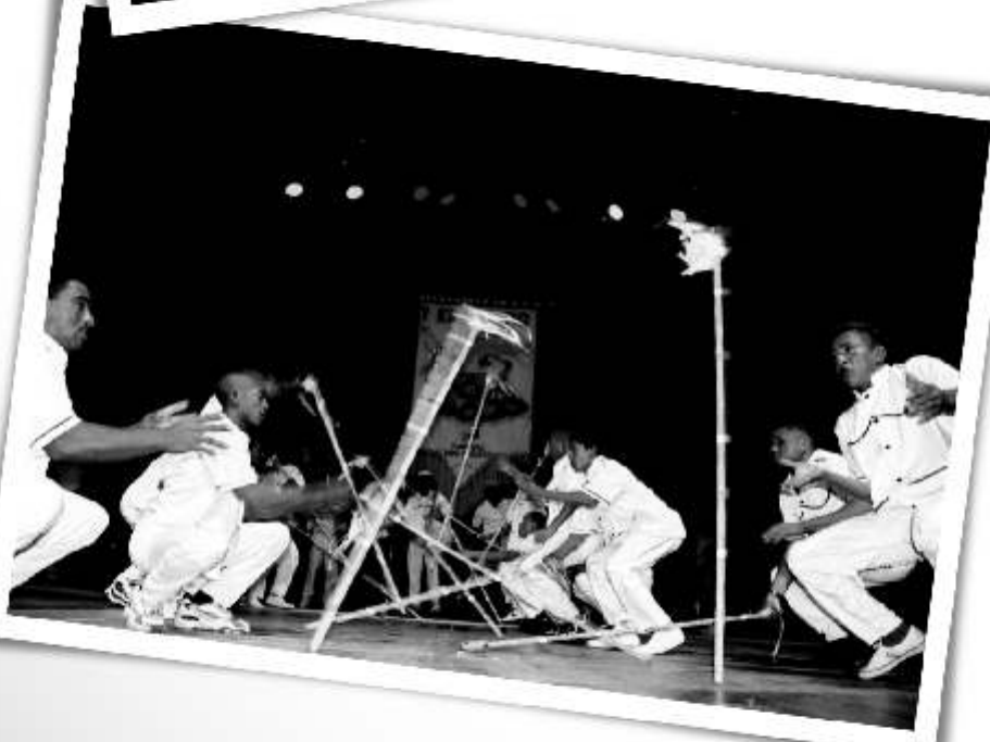
Dança do Espontão Caicó/RN