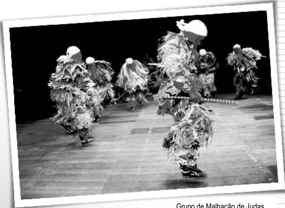
Grupo de Malhação de Judas Major Sales/RN