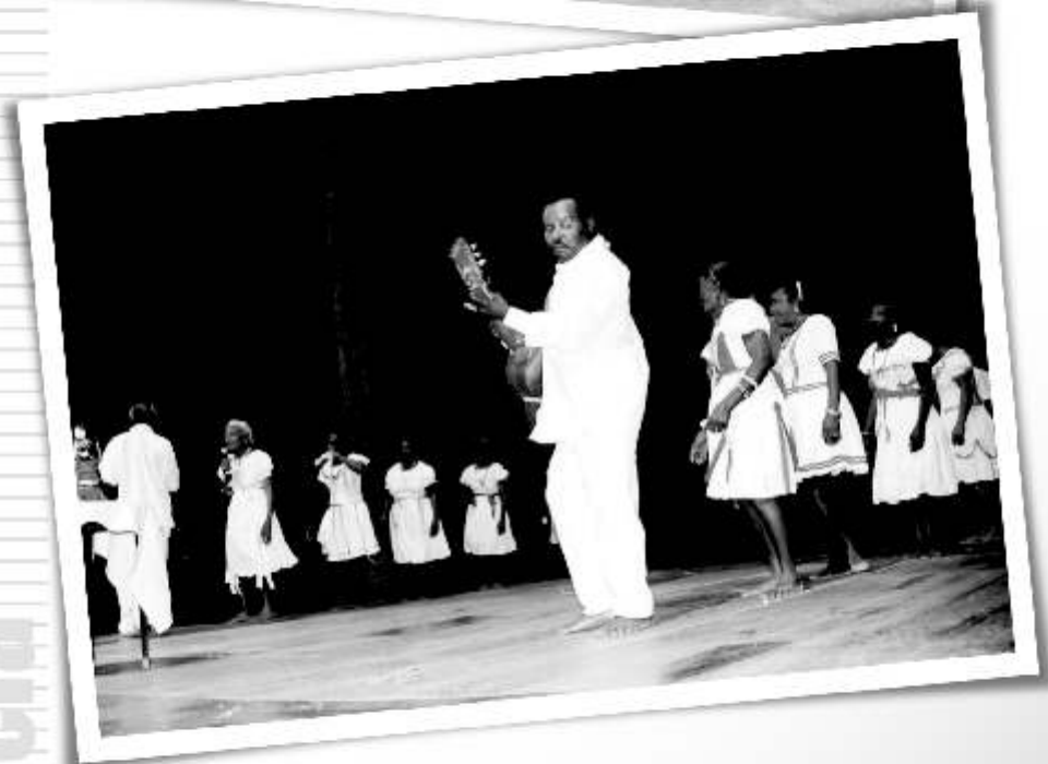
Dança de São Gonçalo Portalegre/RN