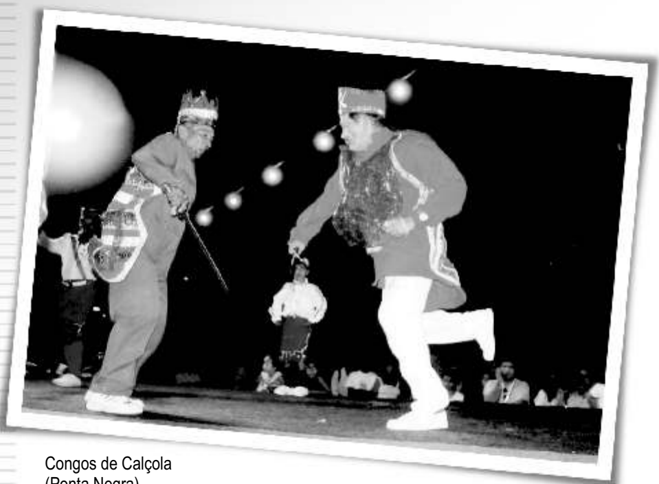
Congos de Calçola (Ponta Negra) Natal/RN