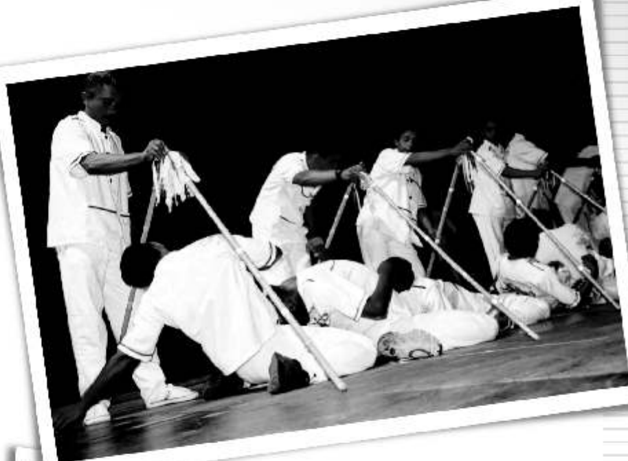
Dança do Espontão Caicó/RN