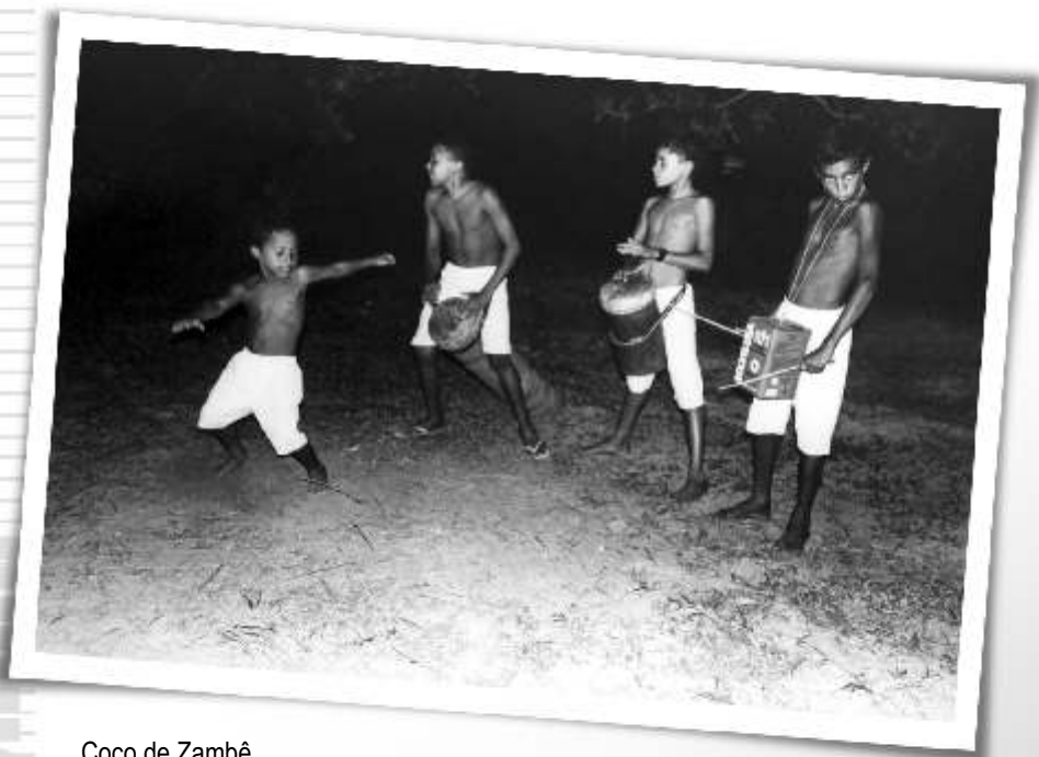
Coco de Zambê (Pernambuquinho) Tibau do Sul/RN