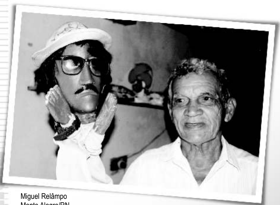
Miguel Relâmpo Monte Alegre/RN