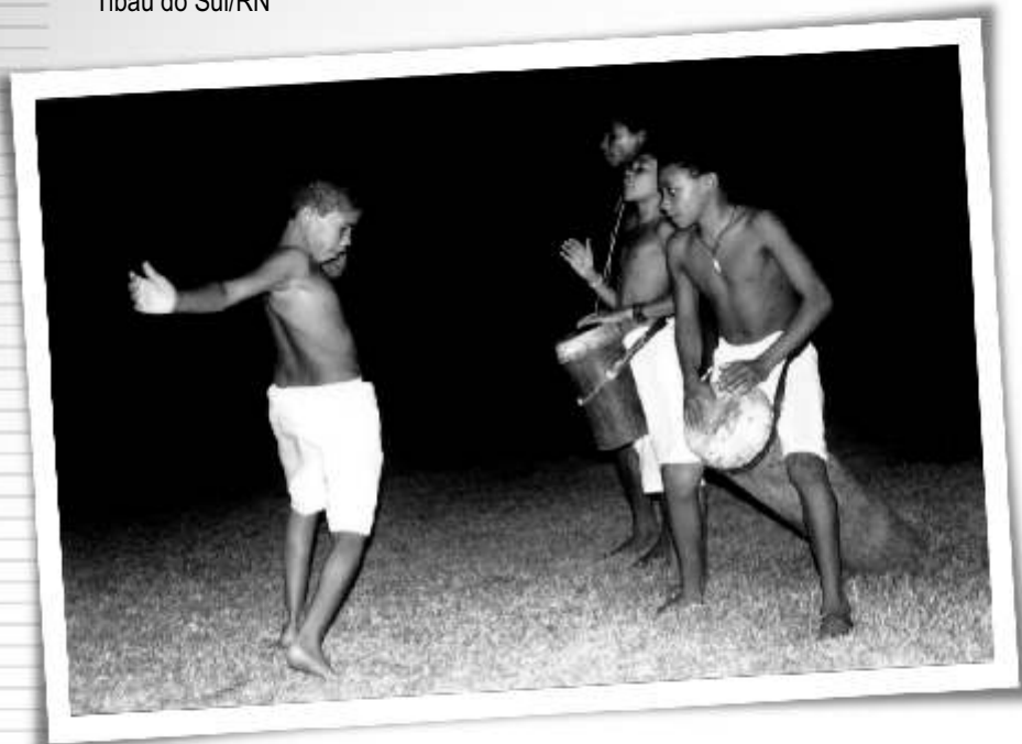
Coco de Zambê (Pernambuquinho) Tibau do Sul/RN