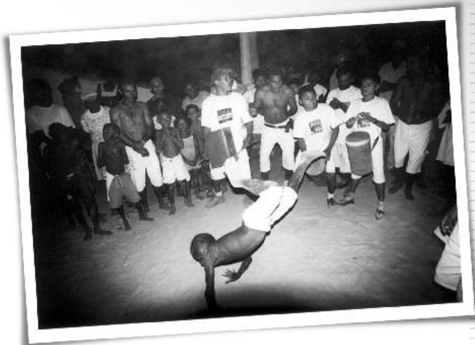
Coco de Zambê (Capoeira dos negros) Macaíba/RN